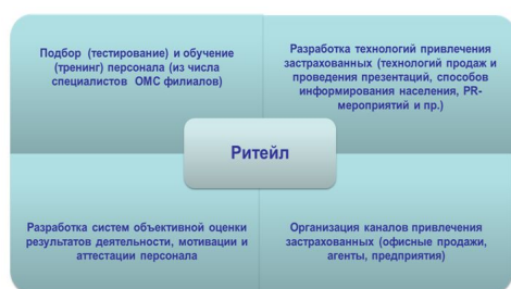
Рис. 1. Ритейловые» технологии, используемые СМО для сохранения страхового поля и привлечения новых застрахованных

Известно, что страховой маркетинг как самостоятельное направление возник на Западе в начале 70-х годов прошлого века. В России это явление оставалось практически